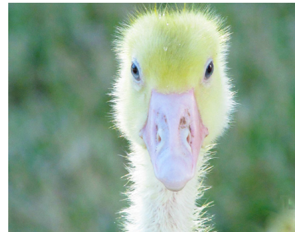
Neugierig geworden? Dann besuchen Sie den Grünen Gänsehof oder dessen Website. Dort gibt es viel zu entdecken.

Ab sofort können Interessierte Vorbestellungen telefonisch, per Mail, über die Website oder auch bei den Vermarktungspartnern